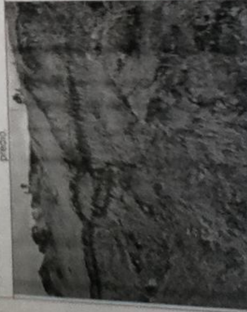
Fotos 3 y 4. Detalle del frente de explotación activo. Nótese que no es claro el seguimiento a un diseño minero.