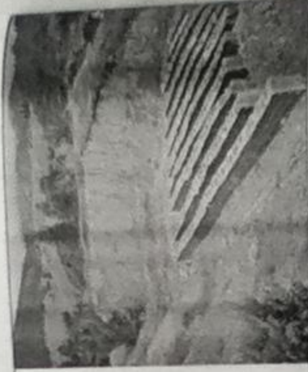
Foto 2. Frente de explotación inactivo y patio de explotación.