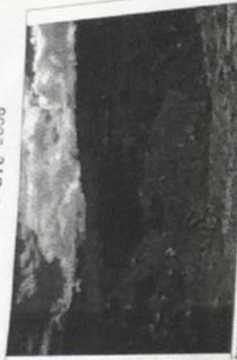
Foto 1 y 2. Detalle del frente actual de explotación. Se observa un terraseo y labores de empujamiento de las aguas de escorrentía para el manejo de las aguas de escorrentía.