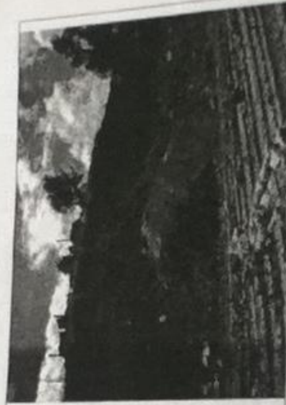
Foto 4. Frente antiguo de explotación sin restaurar.